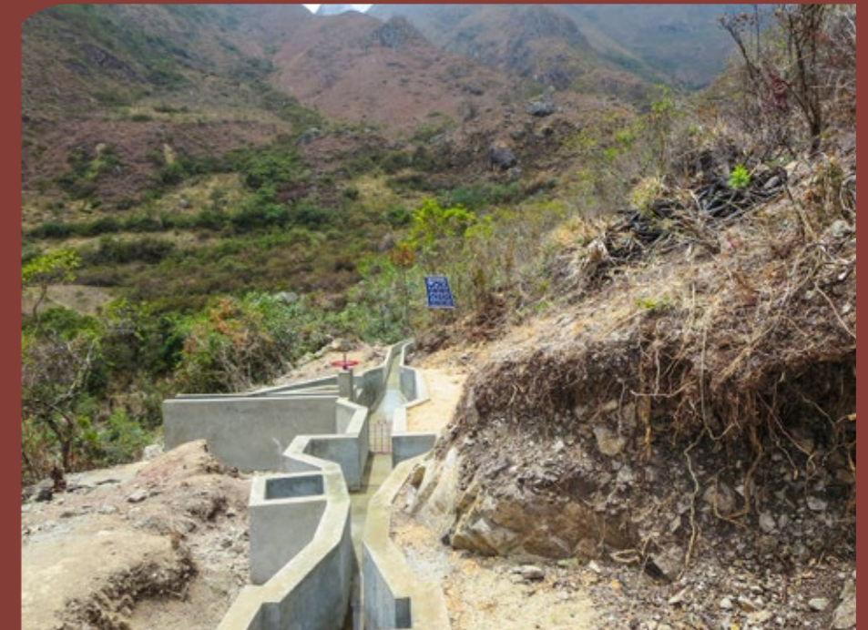
▲ Infraestructura de Riego Chuquitambo – Carrizales. Desarenador y medidor Parshall.