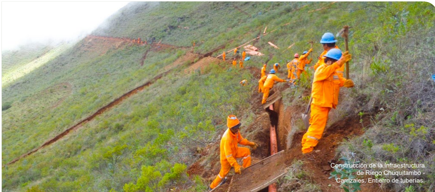
Construcción de la Infraestructura de Riego Chuquitambo - Carrizales. Entierro de tuberías.