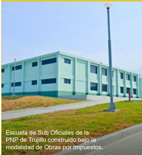
Escuela de Sub Oficiales de la PNP de Trujillo construido bajo la modalidad de Obras por Impuestos.