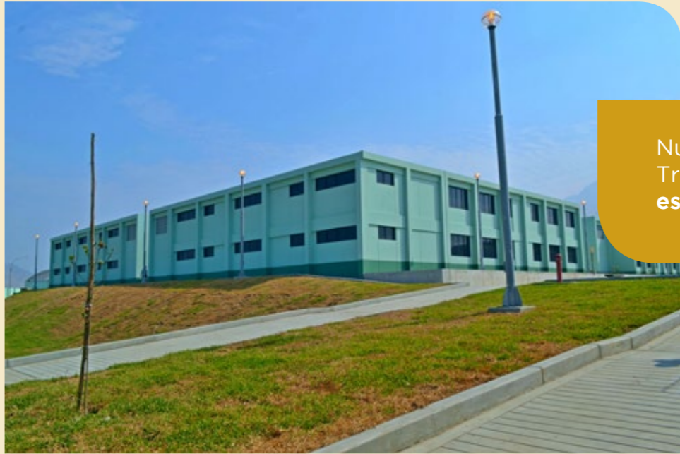
Nueva Escuela PNP de Trujillo formará a más de 400 estudiantes el primer año.