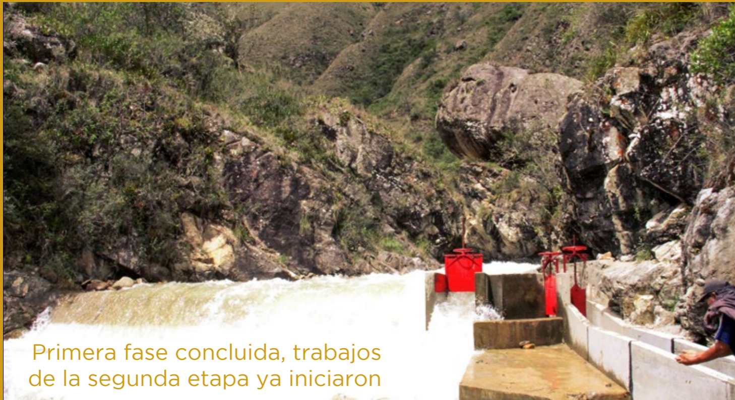
Primera fase concluida, trabajos de la segunda etapa ya iniciaron