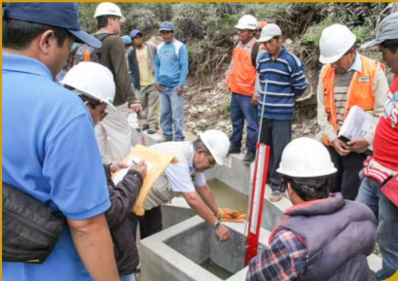
▲ Revisión del buen funcionamiento del canal.