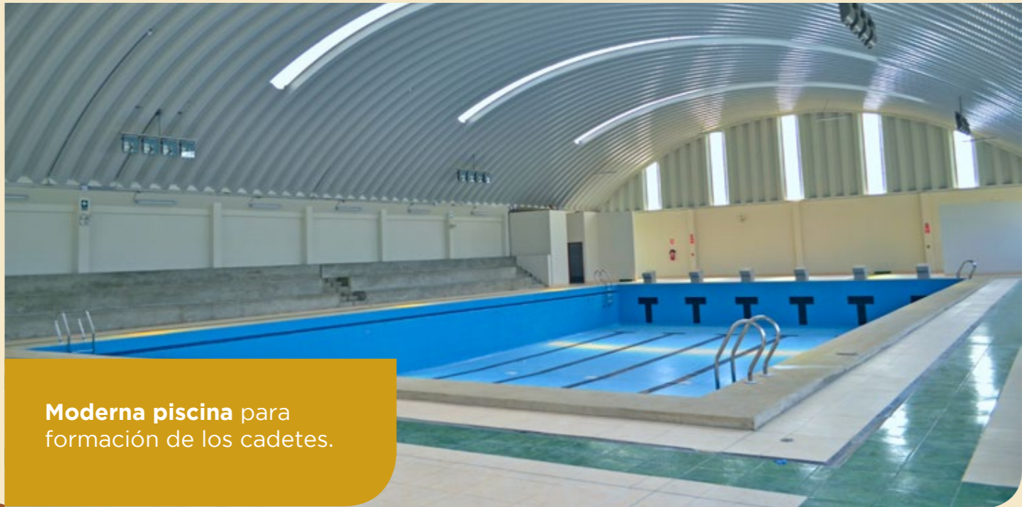
Moderna piscina para formación de los cadetes.

Se prevé que cada año egresen 280 nuevos efectivos policiales formados en esta escuela.