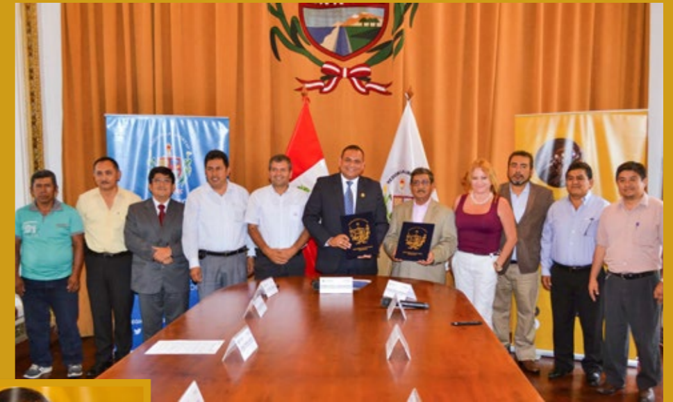
▲ Firma del Acta Protocolar de entrega del terreno. Participan gobierno regional, distrital, comunidad, PODEROSA y empresa contratista.

Esta segunda etapa prevé la instalación de un sistema integral de redes de riego tecnificado por aspersión, para más de 200 hectáreas de la comunidad. Se construirán 23 cámaras de carga con cerco perimétrico, 197 cámaras rompe presión y 6 cámaras repartidoras y 693 hidrantes de riego. La obra incluye 2986 metros de tuberías de conducción y 45,403 de distribución, tuberías de PVC de 8 a 2 pulgadas y 106 módulos de riego.