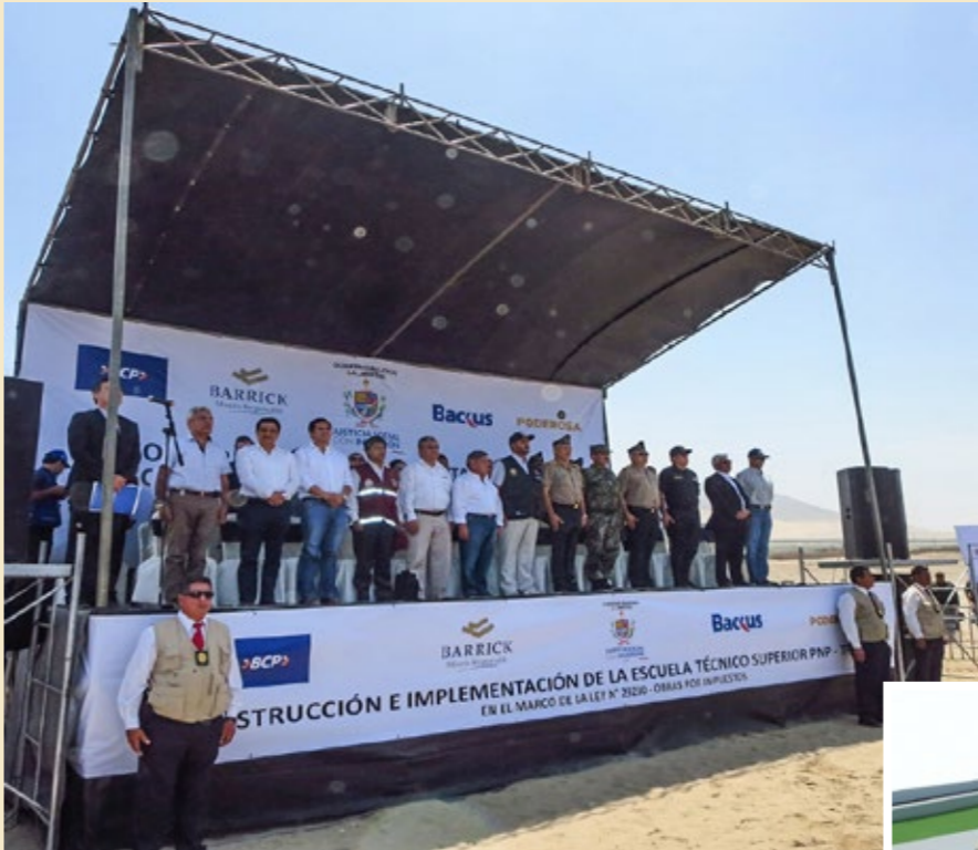
2015. Ceremonia de colocación de la primera piedra.

Se prevé que cada año egresen 280 nuevos efectivos policiales formados en esta escuela.