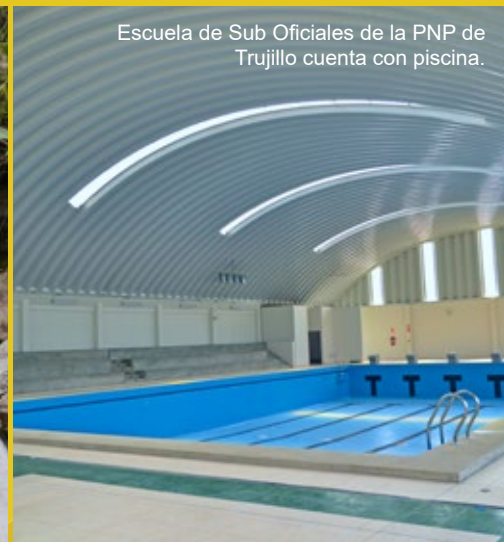
Escuela de Sub Oficiales de la PNP de Trujillo cuenta con piscina.