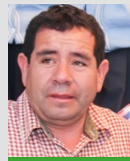
Robert Bogarín Vigo Alcalde provincial de Pataz