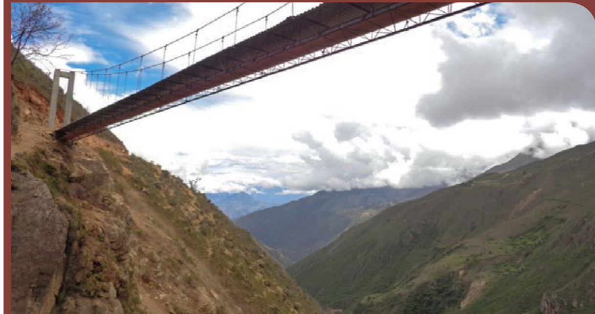
◀ Infraestructura de Riego Chuquitambo – Carrizales. Pase aéreo.