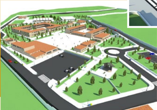
Infraestructura con diseño moderno y funcional.