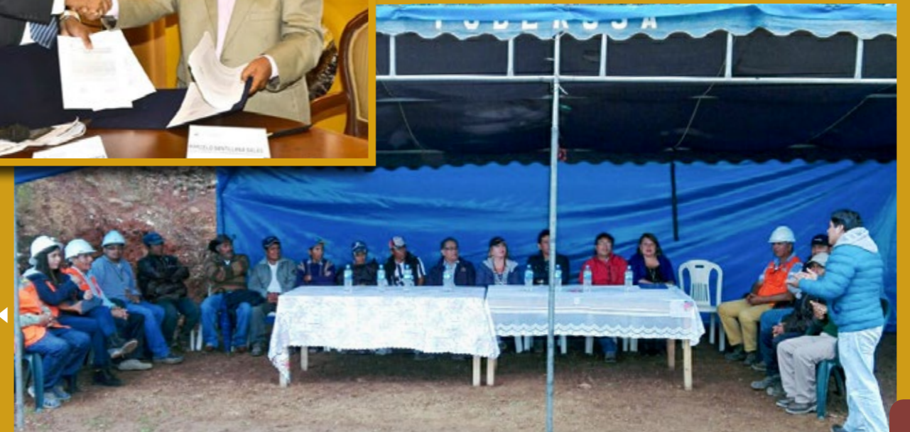
◀ Firma de Acta de Suscripción de entrega de terreno en el anexo de Chuquitambo.