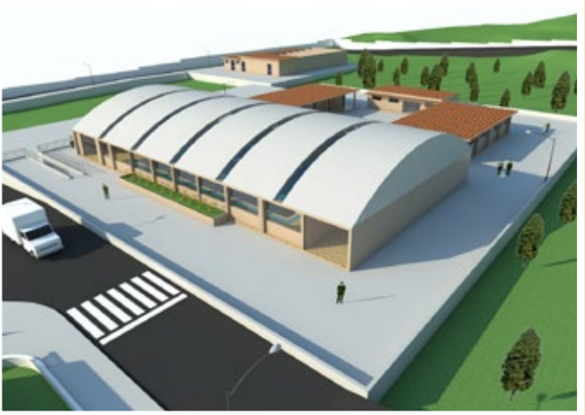
Exterior de piscina. Espacios para la recreación y deporte de los cadetes.