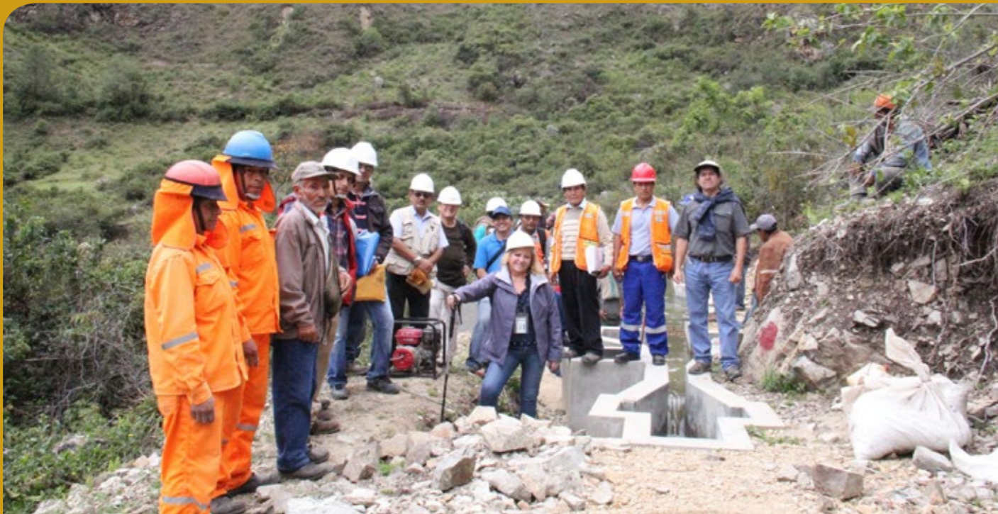
▲ Recorrido de inspección de la entrega de la primera fase de la obra.