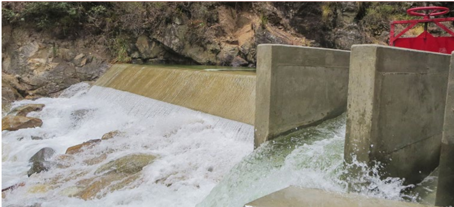
▲ Obras por impuestos: Infraestructura de Riego Chuquitambo – Carrizales. Bocatoma y compuerta.